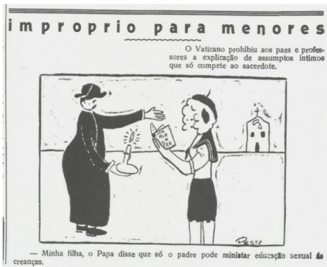
O Vaticano proibiu aos pais e professores a explicação de assuntos íntimos que só competem ao sacerdote. - Minha filha, o Papa disse que só o padre pode ministrar educação sexual às crianças. O Homem do Povo. São Paulo, 28 de março de 1931, n. 02, p.01).