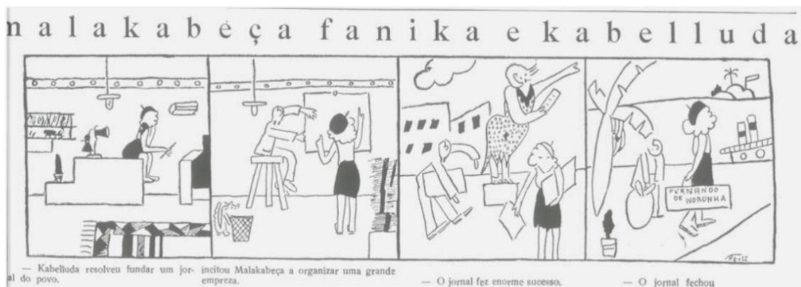
- Kabelluda resolveu fundar um jornal do povo/ - incitou Malakabeça a organizar uma grande empresa/ - O jornal fez enorme sucesso/ - o jornal fechou (O Homem do Povo. São Paulo, 27 de março de 1931, n. 01, p.05).