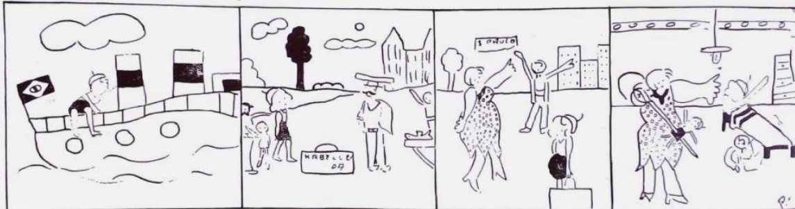
— Kabelluda fugiu pra Portugal. — Os portugueses sentiram o cheirinho e deram em cima. — Kabelluda voltou com Kabelludinha para o gozo de Malakabeça. — Fanika moralista estragou porque Kabelluda era solteira.

- Kabelluda fugiu para Portugal/- Os portugueses sentiram o cheirinho e deram em cima/Kabelluda voltou com Kabelludinha para o gozo de Malakabeça/Fanika moralista estragou porque Kabelluda era solteira. (O Homem do Povo. São Paulo, 07 de abril de 1931, n. 06, p.06).